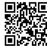
▲特設サイト QRコード

今年のチームスローガン「BE THE FIRE」とかわいいコーロンがプリントされた赤が印象的なミニタオルです。レジャーやスポーツ観戦でお使いいただけます。