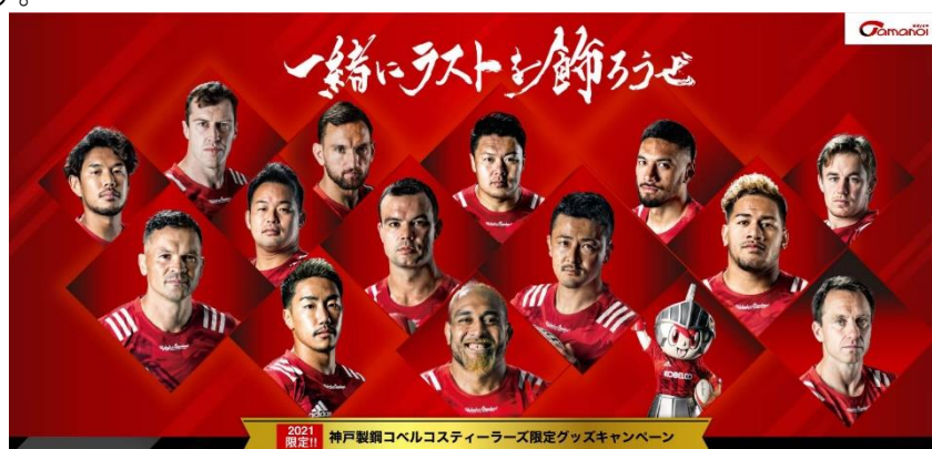
▲特設サイトイメージ

また、本キャンペーン実施に伴いまして、タマノイ酢公式 HP 上にて限定コラボグッズのオンラインショップを開設いたします。