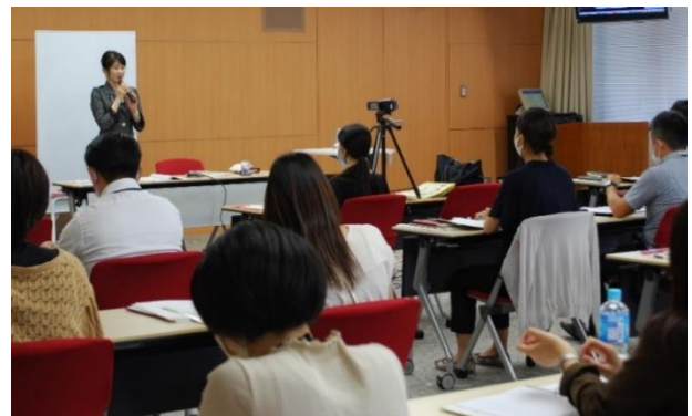
▲講習会の様子。ソーシャルディスタンスに配慮しながら実施。一部リモートで参加する社員もいた。

当社はこれまでにこうした資格を活かし、新商品の発売(写真①)やそれに伴ったホームページの開設(写真②)をしております。また、他社とのコラボレーションや地元堺で季節ごとに薬膳茶のイベントを実施する等、情報を発信しております。今後もお酢にとどまらず、こうした資格を元に専門的な視点から新しい価値の創造を目指しており、「美容・健康」をテーマに薬膳の知見を活かしたご提案をまいります。