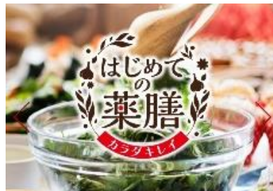
□写真② 「はじめての薬膳」 ホームページ