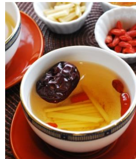
▲薬膳茶イメージ写真