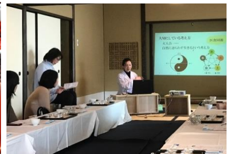
▲茶室でのイベントの様子